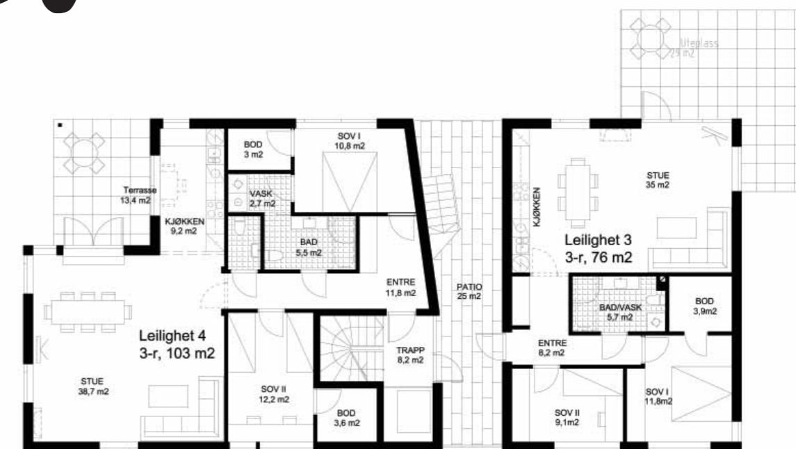
Plantegning 2. etasje

Leilighet 1 (BOA 88 m2/BRA 91 m2): kr 2 840 000.- Leilighet 2 (BOA 107 m2/BRA 111 m2): kr 3 150 000.-