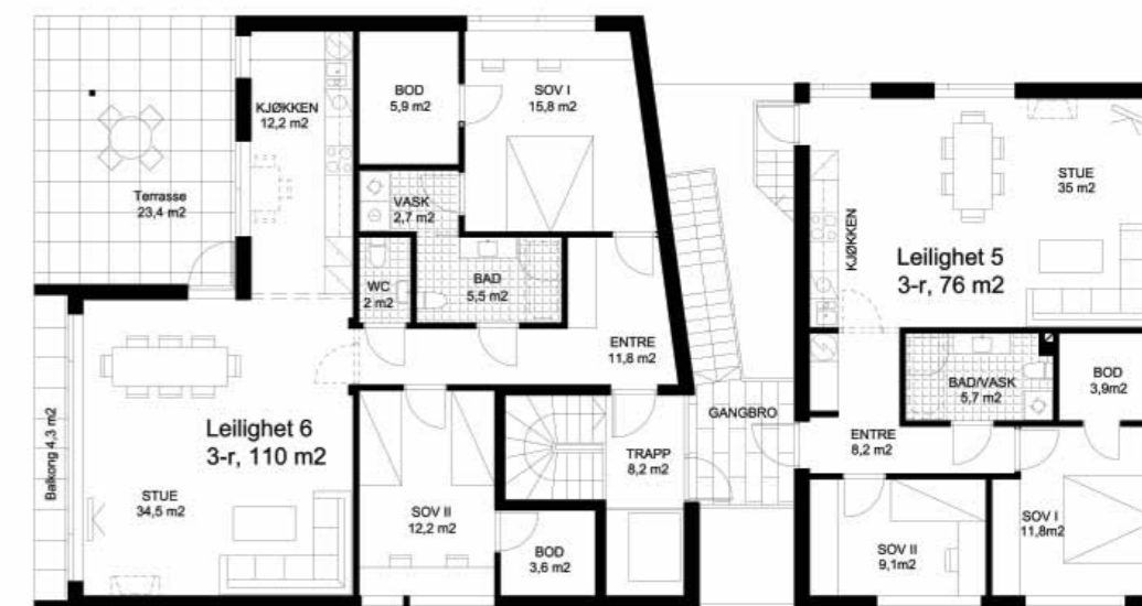
Plantegning 3. etasje

Leilighet 3 (BOA 72 m2/BRA 76 m2): kr 2 540 000.- Leilighet 4 (BOA 99 m2/BRA 103 m2): kr 3 350 000.-